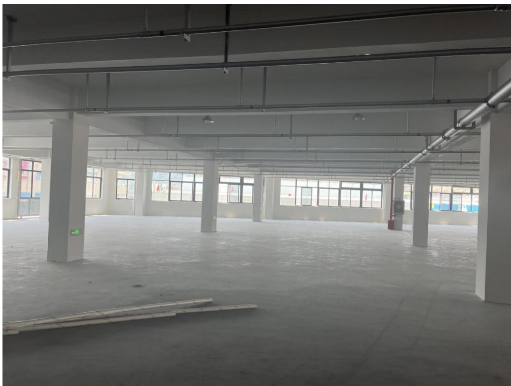
图 2-2 项目厂房现状图